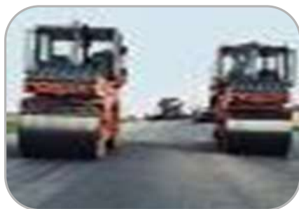
на национальную экономику