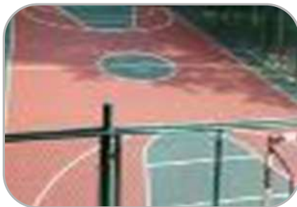
на физическую культуру и спорт