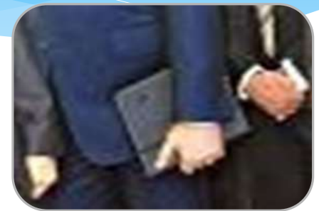
на общегосударственные вопросы