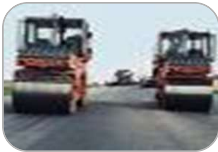
на национальную экономику