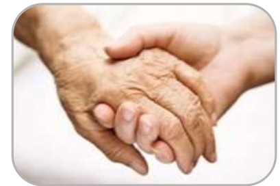
Социальная поддержка граждан