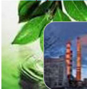
Жилищно- коммунальное хозяйство